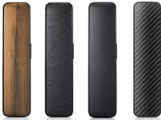
Draadloze hoorn (DECT) Kunststof S30853-H4020-R101 Leer S30853-H4020-R111 Hout S30853-H4020-R121 Carbon S30853-H4020-R131